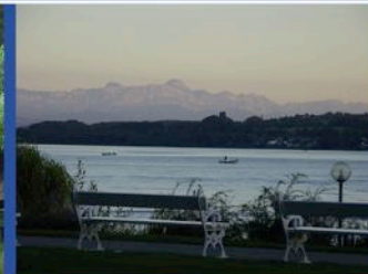
Sämtis vom Kurgarten aus