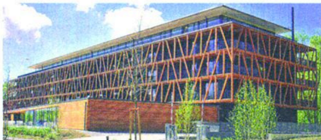
Das Bora-Hotel in Radolfzell.

Ja, das nenne ich Identitätsfindung: Parkhaus gleich Pflanzenhaus gleich Mensa-Uni Karlsruhe gleich Stadion „Vogelnest“ in Peking gleich Hotel in Radolfzell gleich Bildungshaus in Wolfsburg etc.. Schlimmer kann's nicht kommen. Wer nimmt sich heraus zu behaupten: „Beide Baukörper dürften gemeinsam einen unverwechselbaren Ort und damit Identität schaffen“? Diese Identität der Beliebigkeit wurde uns da von externen „Fachpreisrichtern“